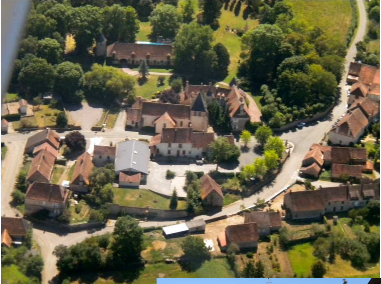
Eglise située au centre bourg