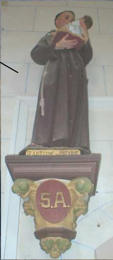
St Antoine de PADOUE